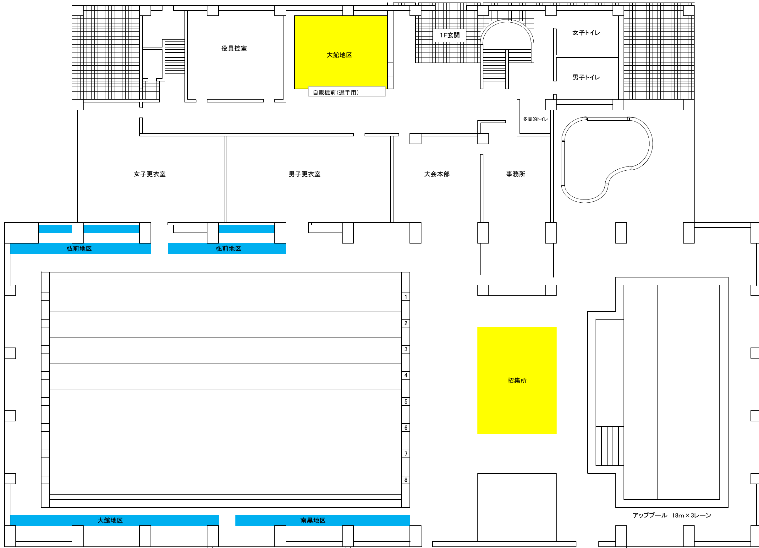
1Fプール席図および選手控え場所