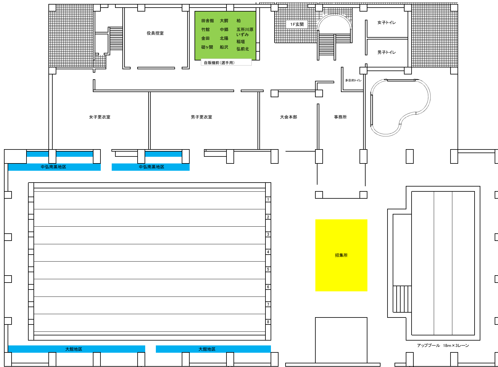
1Fプール席図および選手控え場所