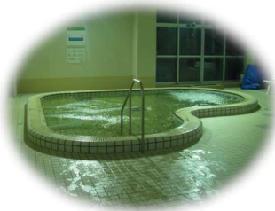
アメニティープール (ジャグジー)

エアロバイク、ウォーキングマシン、各種トレーニングマシン有り。陸トレ後のプール利用可！