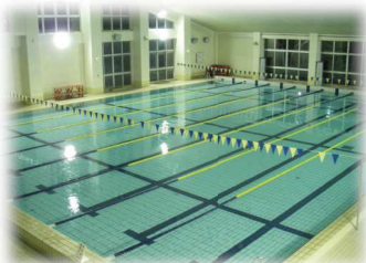
メインプール (25m × 8コース) 水深1.2m

疲れた体をあったかいジャグジーで癒しましょう。細かい泡があなたの体をマッサージ！