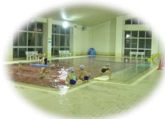
サブプール (18m × 3コース) 水深1.2m (通常0.8m)

本格的大会が行われる公認プール。レーンも広く、ゆったり泳げる。ウォーキング専用コースも有り。